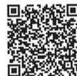
千葉県いじめ防止基本方針