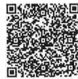
千葉県いじめ防止対策推進条例